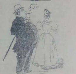
Continúa... De la lluvia... De las flores...