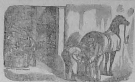
ACUDIR QUE ESTA ES GANGA

Las empresas de transporte, las agencias de coches y todos los que desean caballos bien herrados remitanlos a la Escuela de Artes y Oficios, donde se calzan por el infimo precio de un sucre sesenta centavos.