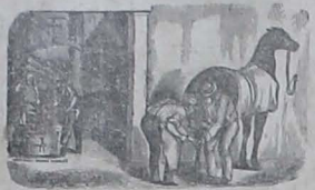
ACUDIR QUE ESTA ES GANGA

Las empresas de transporte, las agencias de coches y todos los que desean caballos bien herrados remitanlos a la Escuela de Artes y Oficios, donde se calzan por el infimo precio de un suere sesenta centavos.