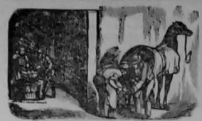
ACUDIR QUE ESTA ES GANGA