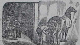
ACUDIR QUE ESTA ES GANGA