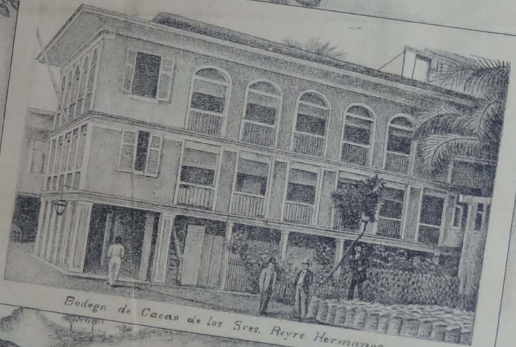
Bodega de Cacao de los Sres. Reyre Hermanos.