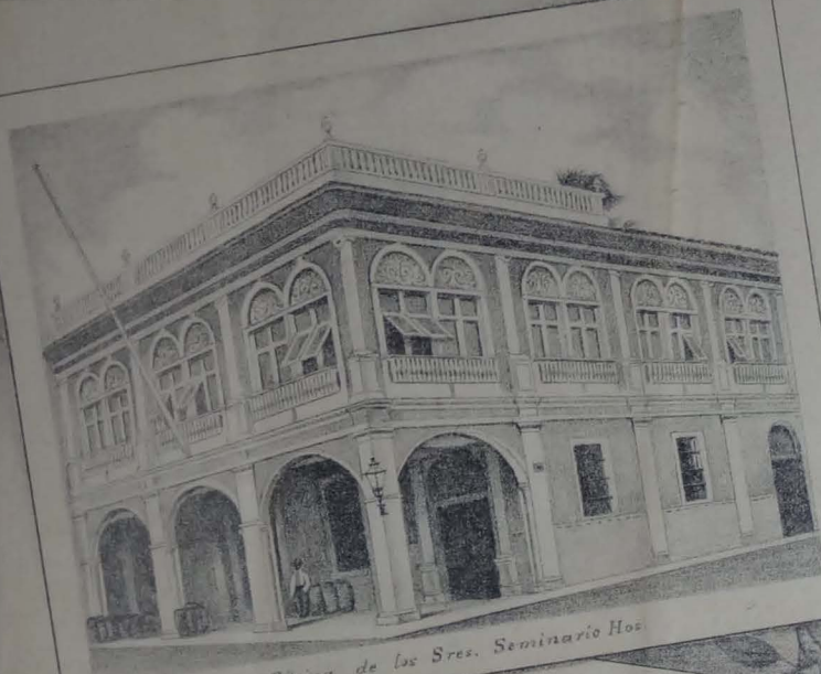
Oficina de los Sres. Seminario Hos