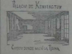
PALACIO DE KENSINGTON

El nombre de la Reina Victoria, pasará a la historia con cortejo de merecidas y altas glorias.