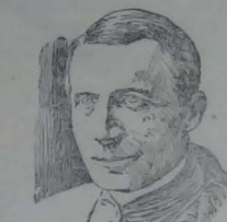
Último retrato del Cardenal Gibbons, Jefe de la Iglesia americana.