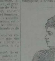
Mrs. Leland Stanford