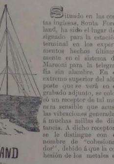
Situado en las costas inglesas, Santa Foreland, ha sido el lugar designado para la estación terminal en las experimentos hechos últimamente en el sistema de Marconi para la telegrafía sin alambre...

Los más antiguos periódicos de la América Latina, los decanos de la prensa sud-americana, son brasileños, y para citar los más antiguos de entre todos, mencionaremos al JORNAL DO COMERCIO, de Rio Janeiro, el DIARIO DE PERNAMBUCO y el MONITOR CAMBISTA. El primero cuenta 77 años de existencia, el segundo 73 y el último 60 años.