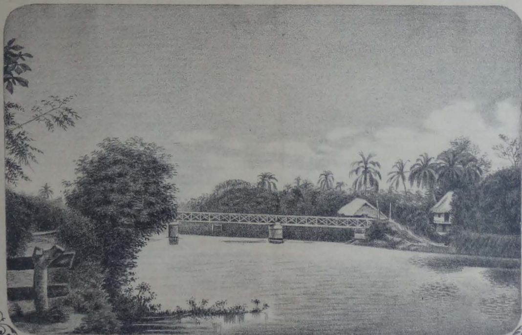
RÍO YAGUACHI Y PUENTE DEL FERRO-CARRIL DEL SUR.