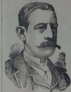
James Gordon Bennett