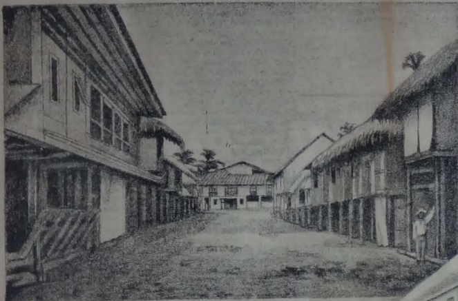
UNA CALLE DE SANTA LUCÍA.