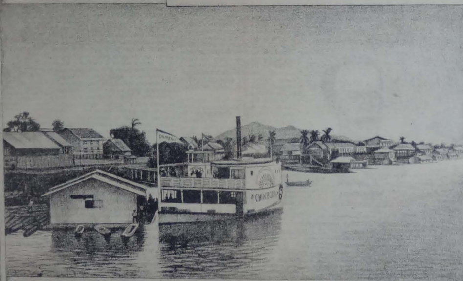
VISTA DE SAMBOROMBÓN