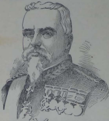
GENERAL MARTINEZ CAMPOS.