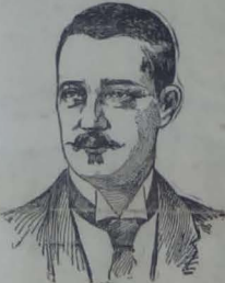
PRINCE ENRIQUE D'ORLEANS