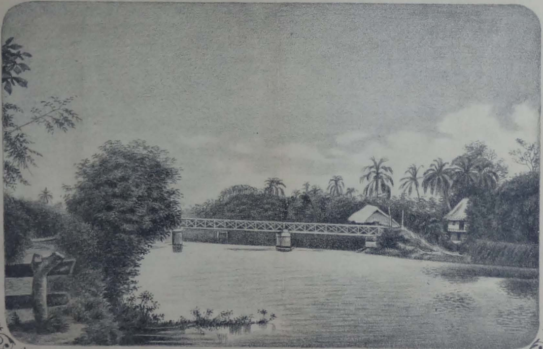
RÍO YAGUACHI Y PUENTE DEL FERRO-CARRIL DEL SUR.