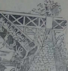
CASTROFE DE BRIDGEPORT