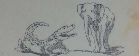
La trompa sensible

En ciertas elecciones que hubo en uno de los maravillosos países que visitó Gulliver, salió vencedor el candidato Elefante, y asumió el poder ejecutivo.