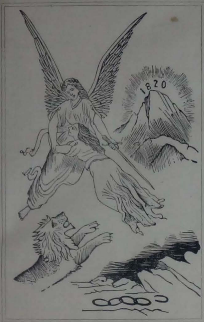
La Aurora de un Pueblo