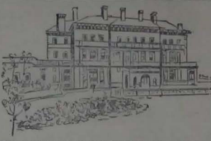
PALACIO DE VANDERBILT EN NEW YORK