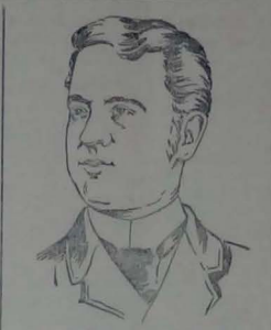
MR. C. VANDERBILT.