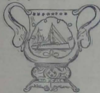
COPA OFRECIDA AL ADMIRANTE DEWEY POR LA CIUDAD DE NEW YORK

La ciudad de New York, ha presentado al Almirante Dewey como testimonio de aprecio y gratitud por los servicios prestados en la guerra hispano-ameri-