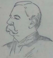
ADMIRAL HENRY L. HOWISON

cana, una hermosa copa, obra de los bien conocidos lapidarios y joyeros Tiffany & Co. Está hecha de oro de 18 quilates, tiene una altura de 29 centímetros y capacidad para cuatro y medio litros. En contorno del cuello de la copa, van 45 estrellas, que representan los Estados de la Unión, y en el centro hay tres medallones: uno con el retrato del héroe de Manila, otro con una diminuta reproducción del navío almirante Olimpia , y el tercero con el esculpido de armas de la ciudad. Con decir que el trabajo ha sido ejecutado en la casa de Tiffany & Co. se ahorra cualquier otro elogio sobre el mérito artístico de la joya.