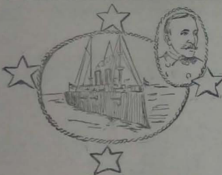
ALMIRANTE DEWEY Y EL NAVIO 'OLIMPIA'

ciudad vistió de gala, y los espectadores, agolpados el primer día en las costas de New York y Jersey, presenciaron la gran parada naval y al día siguiente, dispersados desde la calle 129 hasta Washington Square, asistieron al paseo triunfal.