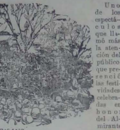
Carta de Lima

Mucho de este efecto moral se debe a que se sabe que están por llegar 600 hombres.