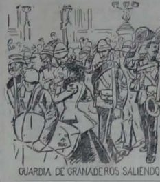
GUARDIA DE GRANADEROS SALIENDO DE LONDRES.

Alcaldía en Samoa ATA.—Fue izada la bandera alemana en la casa de la Corte, como notificación oficial de la anexión de las Islas al Imperio Alemán. El General Atenida en una conferencia a bordo del "Comoran" con los jefes samoaes, les dijo que los habitantes de Samoa podrían pagar un precio, éstos les informaron que Mataafa está el elegido. Periclitó de Dreyfusta PARIS.—Se anuncia fundado de un periódico sostenido por la familia de Dreyfus y dirigido por Clemenceau. La memoria de Zola padre PARIS.—La Academia publica las cartas que se han cambiado entre el Ministro de la Guerra, Gallifit y Emilio Zola, quien desea obtener permiso para examinar los documentos relacionados con su padre, que se encuentran en los archivos del Ministerio de Guerra. Quisiera en su constatación rebasar el permiso solicitado, fundándose en que debe guardar el secreto.