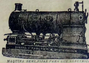
MAQUINA SEMI-FIJAS PARA LUZ ELECTRICA.

En español y portugués, franco de porte y gratis.