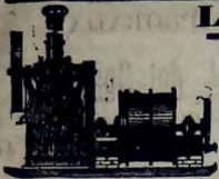
Máquinas de Extracción.

de todas clases de Máquinas de Vapor para Minería y Industria.