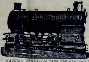
MÁQUINA SEMI-FIJA PARA LUZ ELÉCTRICA.

En español y portugués, franco de porte y gratis.