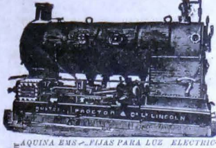
MÁQUINA EMS-FIJA PARA LUC. ELECTRIC.

En español portugués, francés de parte y gratis.