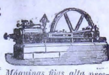
Máquinas fijas alta presión y Compound.