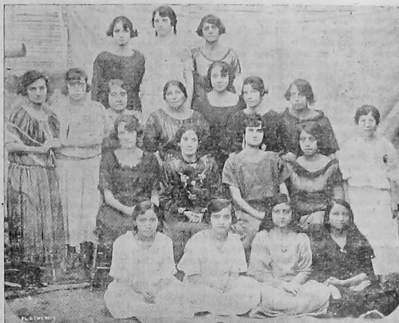
Grupo de distinguidas matronas y señoritas de la culta sociedad jipijapense, que componen el «Comité reconstructor de la iglesia parroquial de San Lorenzo de Jipijapa»

A esa prensa roja que, aprovechándose de la menor ocasión, sopla y sopla desesparada sobre la hoguera liberal, acrecentando el fuego de odios y venganzas en contra de los ciudadanos independientes que militan en la oposición, podemos sacarle en cara su inconsecuencia, su miseria, su injusticia. Porque en efecto, ¿qué mayor inconsecuencia que pregonar libertad y atacar a quien hace uso de ella para delenderse? ¿Qué más triste miseria que constituirse en delator, perseguidor y verdugo de sus hermanos, sólo por cumplir consignas, o satisfacer odios o venganzas, o sostener intereses personales o egoístas? ¿Qué más grande injusticia que lanzarse sin misericordia ni humanidad contra los caídos, los vencidos, contra los que realizan un verdadero heroísmo, le vantando su voz en medio de la catástrofe para defender al hermano que sucumbe