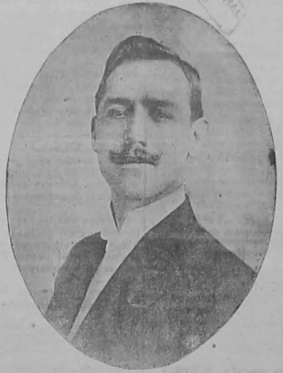
Excmo. Sr. Dr. Enrique Olaya Herrera, MINISTRO DE RELACIONES EXTERIORES DE COLOMBIA.