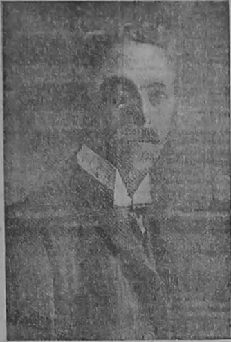
Excmo. Sr. Dr. Carlos Restrepo, ACTUAL PRESIDENTE DE COLOMBIA.