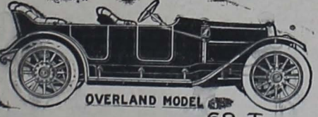
OVERLAND MODEL 69 T

Tengo el gusto de ofrecer al público el nuevo Modelo de 1913, sin bombo de ninguna clase, invito a los expertos en automóviles y en maquinarias finas, de alta calidad superior, para que compran las máquinas "Overland" con las similares del mismo precio y aun con las que cuestan 30 a 100 más, en la seguridad que las encuentren mejor en todo concepto, fuerte, elegante, de fácil manejo, silenciosa. No respeta los malos caminos, ni cuestras. Su máquina es tan sencilla que cualquiera puede comprenderla sin ninguna dificultad. Esta es la máquina que se ofrece al público y por un precio sumamente bajo en la oficina arriba expresada.—Enero 1° de 1913.—30 v.—1010.