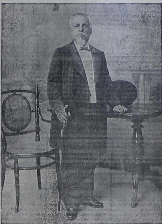
General don Eloy Alfaro

"¿Cómo no sospechar de las vinculaciones de Rochette con el grupo de banqueros, Carbono-Dupuy, que ha llegado á Quito con la intención de fundar un Banco á la sombra de nuestras liberales leyes?"