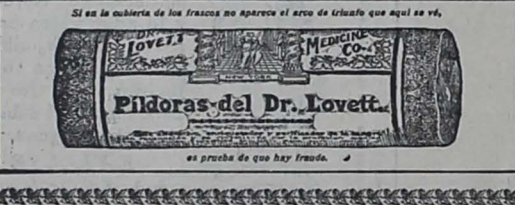
Si en la cubierta de los frascos no aparece el arco de triángulo que aquí se ve, es prueba de que hay fraude.

DR. LOVETT MEDICINE CO., Lock Box 77, Nueva York, E. U. de A.