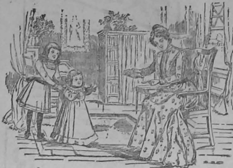
El Primer Paso