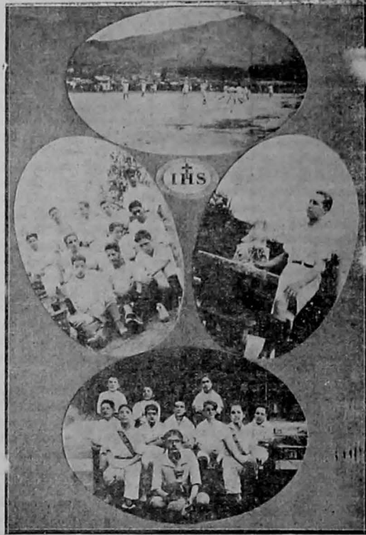
Equipos de foot-ball del Colegio de San Gabriel