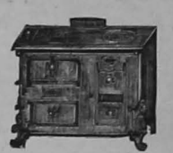
Cocinas francesas con platos Acide Rafael Puente.

GRAN surtido de cujas de fierro, lavatorios, vides, excusados de porcelana y papel lumérico para él, vende muy barato J. J. Narváez R.