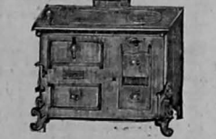
Cochas fra. ce as completas vende Rafael Puente.

Las mejores herramientas para artesanos se hallan donde Rafael Puente.