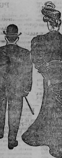
Si vos sois bajo de estatura, esta es la manera que os veis cuando vais acompañando a una persona de estatura regular.

Os Sorprenderá las Informaciones que Nuestro Maravilloso Libro Contiene. Una Tarjeta Postal que Escríbala Será Suficiente para que lo Obtengáis.