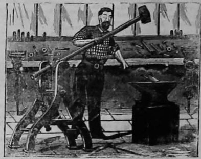
LAS MEJORES HERRAMIENTAS DE LA PLAZA

Yunque. Martillos de todo modelo. Taladros. Brocas para acero y metal. Entenallas. Limas de varias figuras. Vueltas. Tarrajas finas para mecánicas. Ternajas para tubos. Sierras para fierro y metal. NUEVOS SURTIDOS (a precios cómodos) llegaron al Almacén de ferretería de