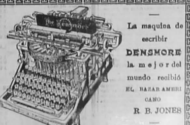
Portrait of a man in a suit, likely a political figure mentioned in the text.