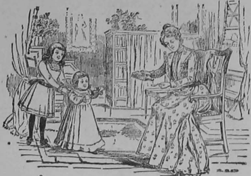
El Primer Paso

Las personas fuertes y robustas no están expuestas á contraer enfer medades como las raquíticas y anémicas. Por su eficacia como reconsti tuyente la legítima Emulsión de Scott de aceite de hígado de bacalao con hipofosfitos de cal y de sosa es la preparación que sin titubear recetan los médicos en todo caso de debilidad ó falta de sangre y de fuerzas. Una constitución fuerte—sangre rica y pura—es el resultado natural de administrar en la infancia la legítima Emulsión de Scott. Es el "primer paso" hacia una salud perfecta por toda la vida, hacia la inmunidad contra casi todas las enfermedades.