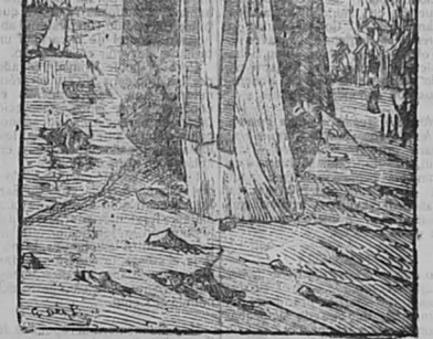
LA ROMERÍA DE SAN JACINTO

Pero nos consuela la circunstancia de que durante once años, hemos visto desfilat por esta gran vía a mucha gente peque-