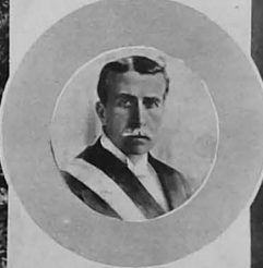
El ex presidente de la Republica del Perú Augusto B. Leguía, que ha fallecido en el Hospital Naval de Bellavista, en Lima