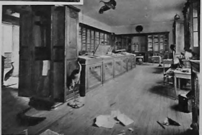
Grupo de religiosos jesuitas del Colegio de Bella Vista, de Vigo, que, en cumplimiento del decreto del Gobierno, han desalojado el edificio Gabinete de Historia Natural del colegio de jesuitas de la calle Alberto Aguilera, del que se incautó ayer el Estado