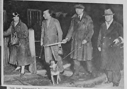
Non tan frecuentes los ataques en algunos Estados de Inglaterra, que los vecinos regresan a sus domicilios en grupos y armados de porras