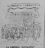
LA LIBRERÍA "CATALUNYA" por Barriada