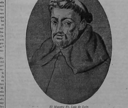
El Maestro Fr. Luis de León Algunos poemas se creyeron en el deber de imitarle... Algunos poemas se creyeron en el deber de imitarle

La juventud literaria española—hoy más que nunca... La juventud literaria española—hoy más que nunca