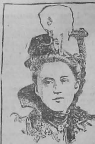
LA BUENA VIDA MATA