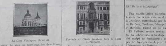
La Casa Velazquez (Madrid). Periodo de Obispo (modelo para la Casa Velazquez).