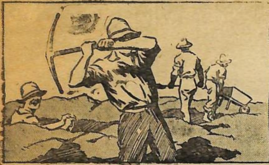
Y aliviado del dolor de cabeza, con el azadón en la mano, sigue abriendo las rutas que ayudarán al progreso de la nación.