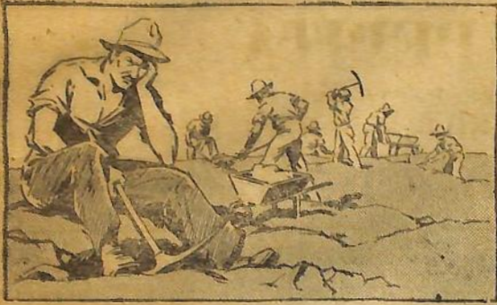
Construyendo caminos... Sol, calor, lluvia, tierra, polvo, aire; trabajo rudo y agotante. Herramientas pesadas: palas, azadones, carretillas. Y muchas veces dolores de cabeza.