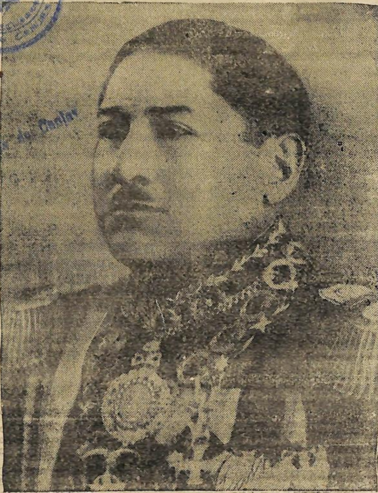
El Presidente Enrique Peñaranda

Esta es la mejor forma de demostrar interés por nuestros pueblos y Mr. Wallace ha dado una severa lección a nuestros gobernantes, al enseñarles como deben atenderse los pedidos, cuando ellos llevan una finalidad altamente provechosa.