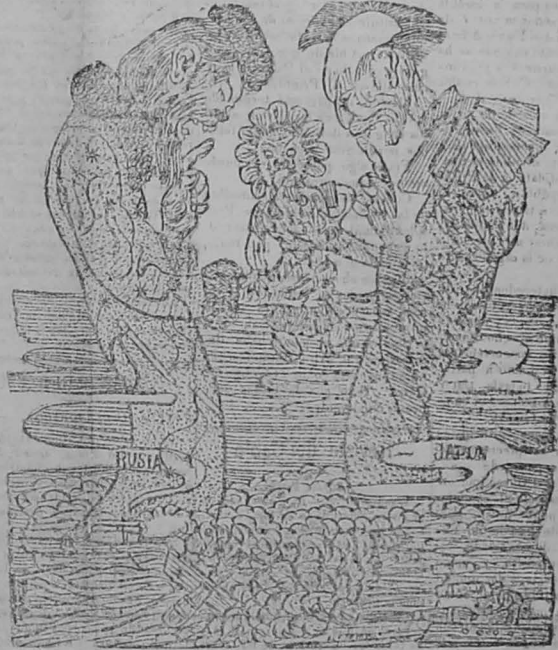
Guerra ruso-japonesa.—La Manchuria es la manzana de la discordia.