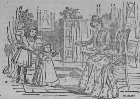
El Primer Paso

Las personas fuertes y robustas no están expuestas á contraer enfermedades como las raquíticas y anémicas. Por su eficacia como reconstituyente la legítima Emulsión de Scott de aceite de hígado de bacalao con hipofosfitos de cal y de sosa es la preparación que sin titubear recetan los médicos en todo caso de debilidad ó falta de sangre y de fuerzas. Una constitución fuerte — sangre rica y pura — es el resultado natural de administrar en la infancia la legítima Emulsión de Scott. Es el "primer paso" hacia una salud perfecta por toda la vida, hacia la inmunidad contra casi todas las enfermedades.