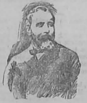
VISITA DE LOUBET A ROMA