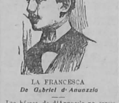
La FRANCESA De Gabriel d'Annunzio