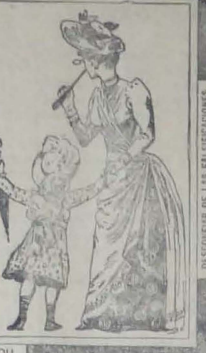
DESCOBRIR DE LAS FALSIFICACIONES