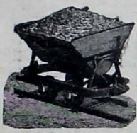
Ferrocarriles de acero portátiles y semi-portátiles.