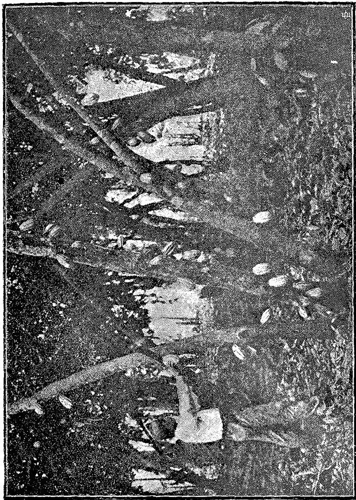
Recolección de cacao