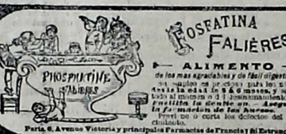
Paris, 6, Avenue Victoria y principales Farmacias de Francia y del Extranjero.

El mejor y el mas agradable de los tónicos, recetado por las celebradas medicinas de París en la ANEMIA, la CLOROSIS, las FIEBRES de toda el se, las ENFERMEDADES del ESTOMAGO las CONVALESCENCIAS.