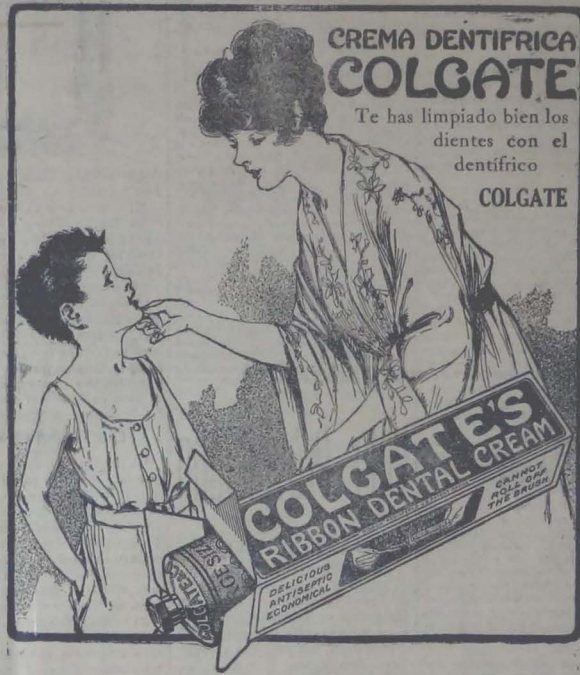
La Pasta Dental Colgate es la preservadora de los dientes y la salvación de los malos

QUITO, abril 9. De Tulcán comunican que el señor J. J. Teniente de Policía ha tomado patrióticamente a su cargo, el levantamiento del censo de la provincia del Carchi, organizando al efecto, las respectivas comisiones que deben trabajar en la ciudad y en las parroquias. CORRESPONSAL